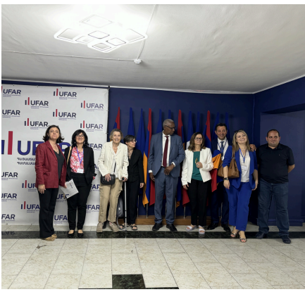
Visite de l'Université Française d'Arménie