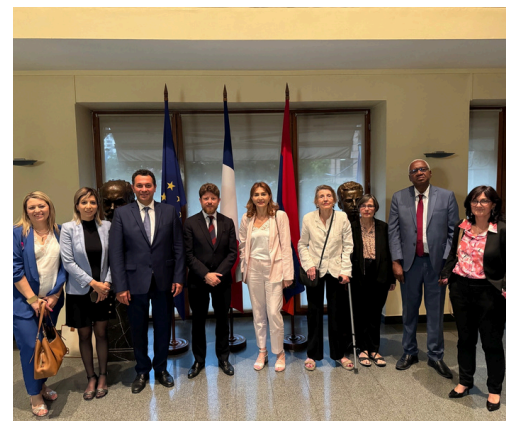
Rencontre avec l'Ambassadeur de France