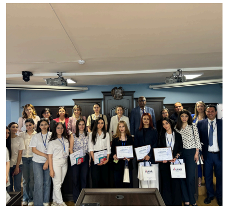
Concours de plaidoirie à l'UFAR