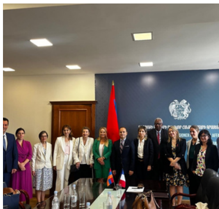
Rencontre avec le Ministre de la Diaspora