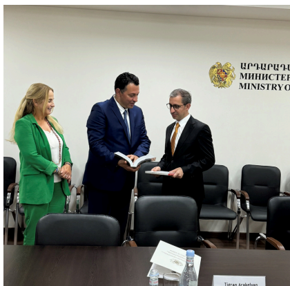
Rencontre avec le Ministre de la Justice

L'Arménie Nous voici réunis, Au cours d'un prompt voyage Confrère amis Tous unis Pour l'Arménie Pour des rencontres en humanité, En solidarité, en partage, En toute simplicité Pour tout bagage Et voici que le Droit nous lie A un esprit commun, Avec les jeunes ou moins jeunes de l'Arménie Celui de la performance, de la formation Grâce aux concours de plaidoiries Du dépassement, sans déni D'autrui De partage du bon sens, D'un accueil sans faille quand j'y pense Et d'une leçon de recherche d'excellence. Qui de nous tous a le plus reçu les fruits De nos réciproques échanges et soutiens Pas de toxiques bruits Agir et non fuir Au mieux pour l'avenir Ici et ailleurs * Pour éviter le pire Les peurs Et préférer les rires.