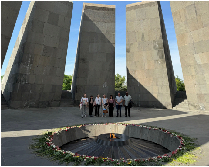
Mémorial du Génocide Arménien du 24.04.1915

Sur la route, nous avons pu admirer des échoppes où on faisait du pain en galette fine ; la pâte est plaquée sur les parois intérieures d'un four qui ressemble à une petite cuve. Passionnant ! La journée s'est terminée par la visite du mémorial du génocide arménien à Erevan : au bout d'une longue esplanade en marbre, le mémorial est composé de cinq énormes stèles en marbre couchées formant un cercle ; au centre brûle le feu du souvenir ; chaque stèle représente une ancienne capitale de l'Arménie. Grande émotion devant ce rappel de l'ancienne grande puissance de l'Arménie devenu un petit pays de deux millions d'habitants enserré entre la Turquie, l'Azerbaïdjan, la Géorgie et l'Iran. Ce petit pays est en danger du fait de la volonté d'expansion de l'Azerbaïdjan et de l'abandon de la Russie sensée le protéger !