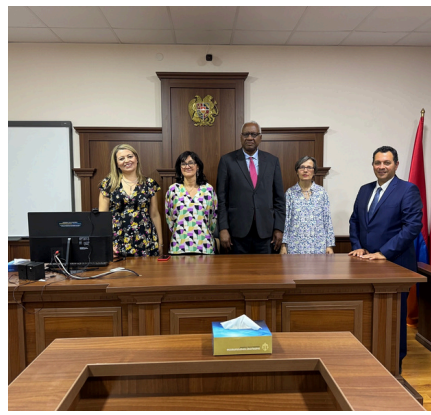
Visite de l'Académie des Avocats