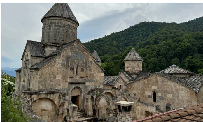
Monastère de TATEV

Le lendemain le concours de plaidoirie nous attendait à l'université française. Nous étions les juges. Le sujet était « la saisine de la Cour européenne des droits de l'homme pour violation de l'article 9 soit l'atteinte à la vie privée ». Deux groupes ont débattu chacun dans une salle et les vainqueurs de chacun se sont affrontés devant le jury que nous formions. Ces jeunes étudiants qui avaient appris le français en deux ans savaient argumenter en Droit et répondre aux questions avec beaucoup de pertinence et de précision. C'était très bouleversant. La lauréate sera accueillie dans un cabinet d'avocat à Montpellier pour un mois ! Le jour d'après les délégations de l'IDH et de la ville de Montpellier ont signé un partenariat tripartite avec une école d'une petite ville à quelques kilomètres d'Erevan et le lycée Nevers de Montpellier.